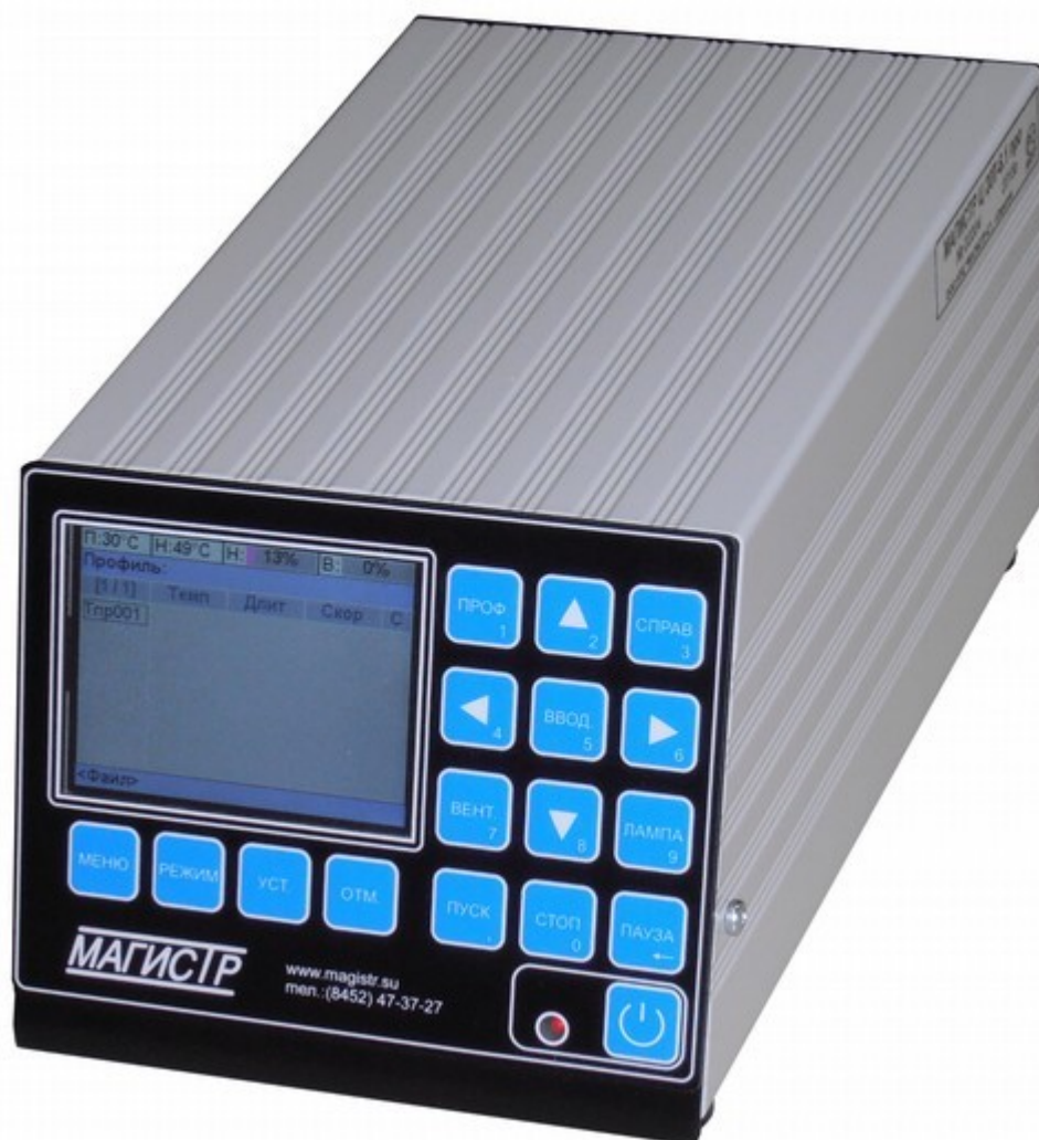
Фото 2. Общий вид блока управления

Термостол и внешний термодатчик при помощи соединительных кабелей подключены к блоку управления. Блок управления считывает показания термодатчиков, управляет мощностью нагрева термостола, а также предоставляет пользователю средства для ввода и редактирования параметров термопрофилей. Конструктивно блок управления выполнен в металлическом корпусе, на задней панели которого расположены клемма заземления, сетевой шнур, сетевой предохранитель, сетевой выключатель, а также соединители для подключения всех остальных элементов станции. На передней панели блока управления расположены ЖК-дисплей, клавиатура и кнопка включения/выключения питания с индикатором питания. Общий вид блока управления показан на фото 2, задняя панель блока управления на фото 3.