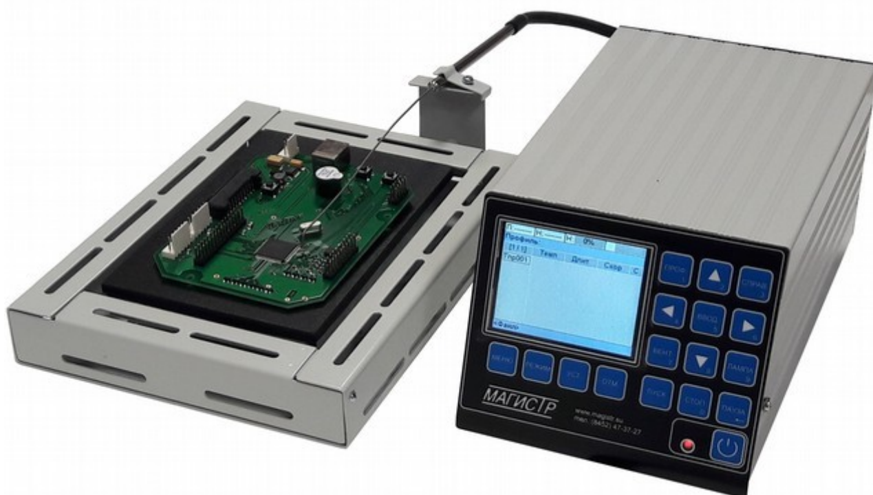
Фото 1. Общий вид станции

Термостол представляет собой плоскую нагревающуюся поверхность, на которой располагают платы либо другие нагреваемые объекты. Термостол имеет места крепления для внешнего термодатчика, который предназначен для контроля температуры в любой точке нагреваемого объекта. Термостол комплектуется крышкой для уменьшения утечки подводимого тепла и обеспечения равномерности нагрева по всему полю стола. Общий вид станции показан на фото 1.