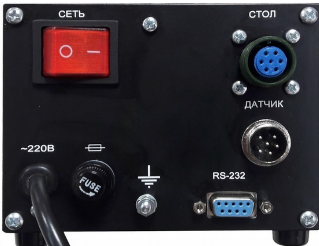
Фото 3. Задняя панель блока управления

Проверьте комплектность станции на соответствие п. 1.4 настоящего РЭ и внешний вид термостола и блока управления на отсутствие механических повреждений.