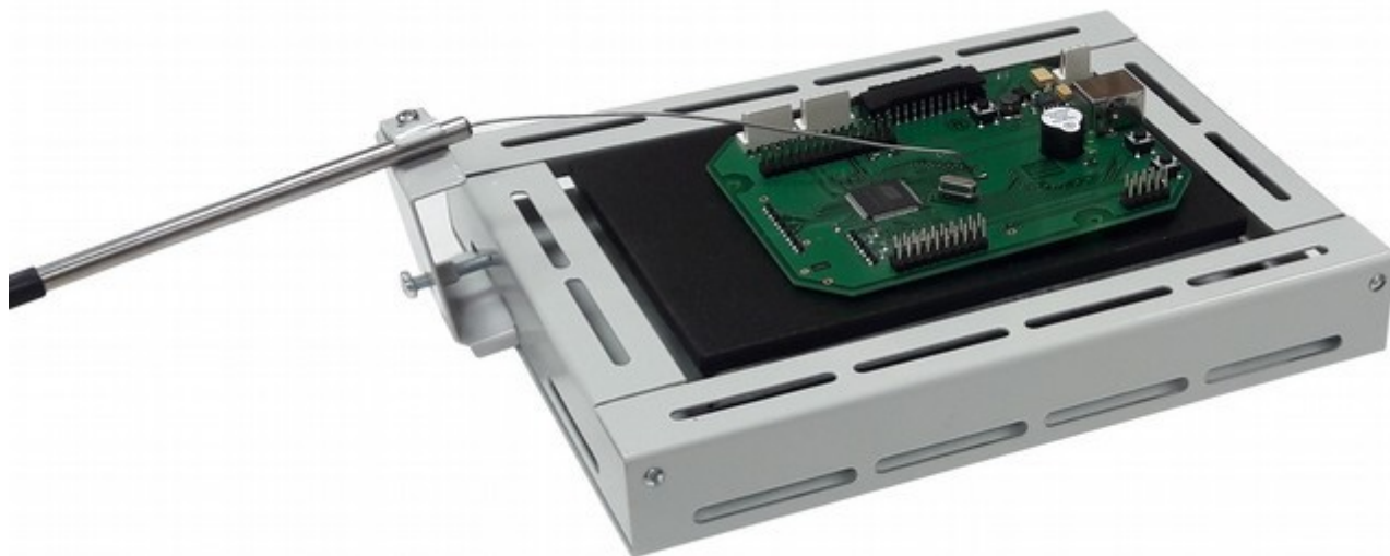
Фото 4. Крепление внешнего термодатчика

некоторый прижимом к ней, за счет пружинных свойств самого термодатчика. После размещения нагреваемых объектов на поверхности термостол и установки внешнего термодатчика, термостол накрывают крышкой, следя за тем, чтобы корпус внешнего термодатчика проходил через один из вырезов крышки.